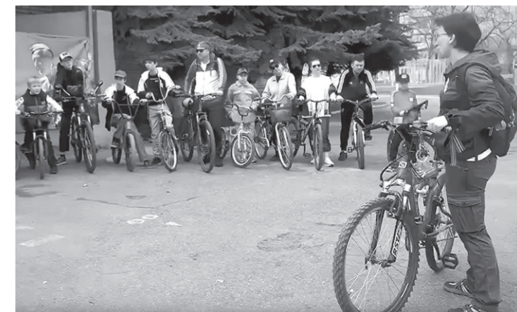
Участники велопробега перед стартом

Велопробег был организован в рамках партпроекта «Единой России» «Выбор Сильных» под эгидой Всероссийского спортивного марафона «Сила России» и собрал молодежь, спортсменов, участников специальной военной операции с детьми. «Мероприятие мы провели, прежде всего, для подрастающего поколения. Ребята должны знать как о великом подвиге народа-победителя, отстоявшего Родину, так и о невиданной жестокости врага, напавшего на нашу землю. Нацисты совершили военные преступления, направленные на уничтожение целых народов. Все это напоми-