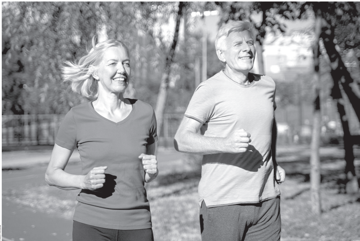
Заниматься физкультурой можно в любом возрасте, но при этом следовать рекомендациям специалиста

Но не забывайте, что здоровый образ жизни — это целый комплекс мер по самосовершенствованию, и начинать его следует постепенно. И первый шаг в этом деле — это питание. Оно должно быть умеренным и разнообразным, потому что организм должен получать все необходимые