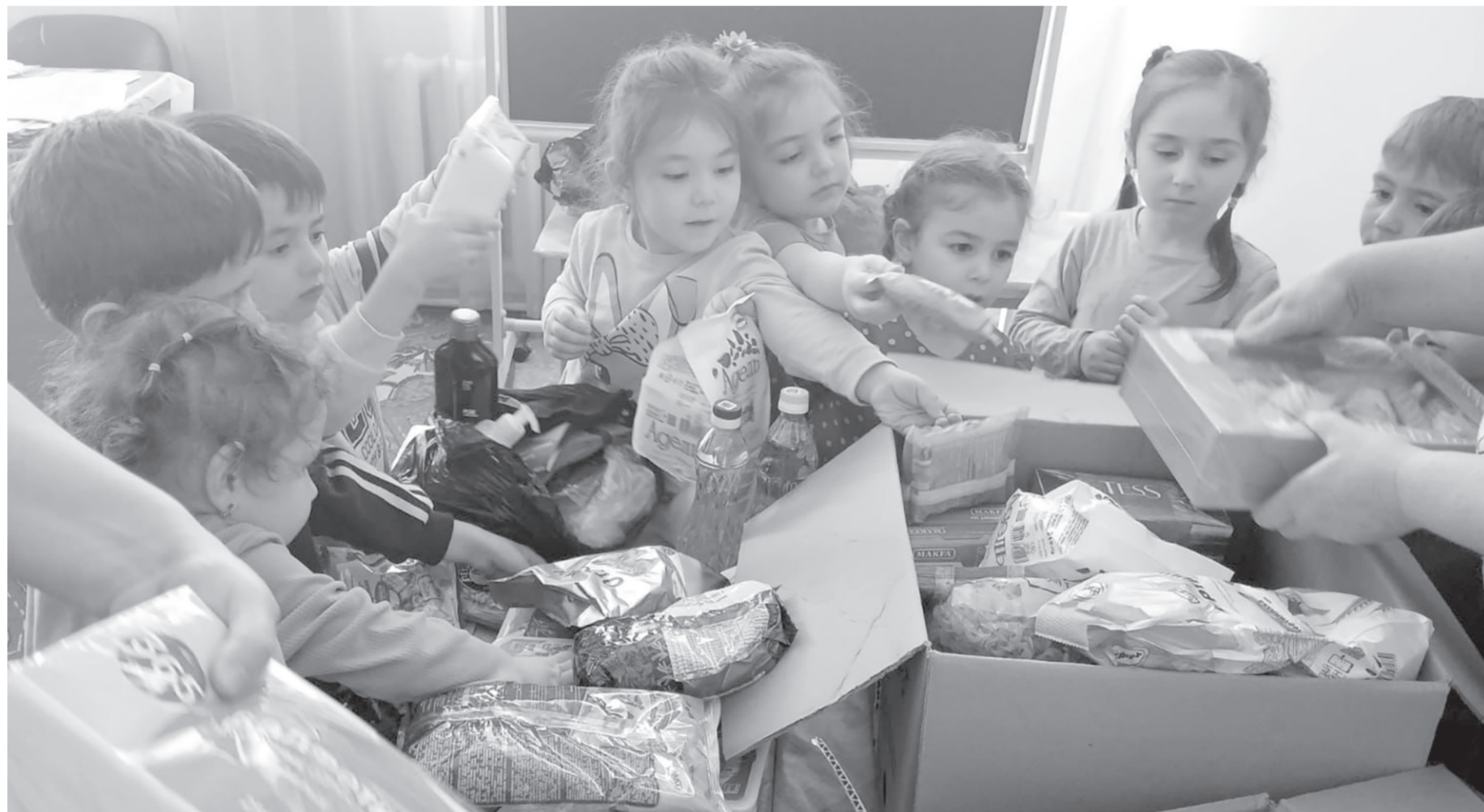
В рамках акции «СВОих не бросаем» педагоги, воспитатели, родители из аула Бесленей собрали очередной гуманитарный груз для бойцов спецоперации

В 2025 году администрацией района выделено для личного подсобного хозяйства многодетным семьям 40 земельных участков, участникам специальной военной операции — 2 земельных участка, членам семьи погибшего (умершего) участника специальной военной операции — 2 земельных участка, предоставлено в аренду 223 земельных участка. Общая численность обучающихся в 2025 году составила 3356 человек. Более 1000 детей охвачено дополнительным образованием. 2025 год, объявленный Президентом Российской Федерации В. Путиным Годом защитника